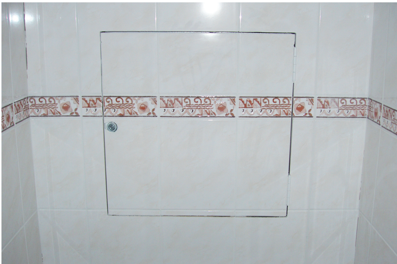
Revizní dvířka Promat®