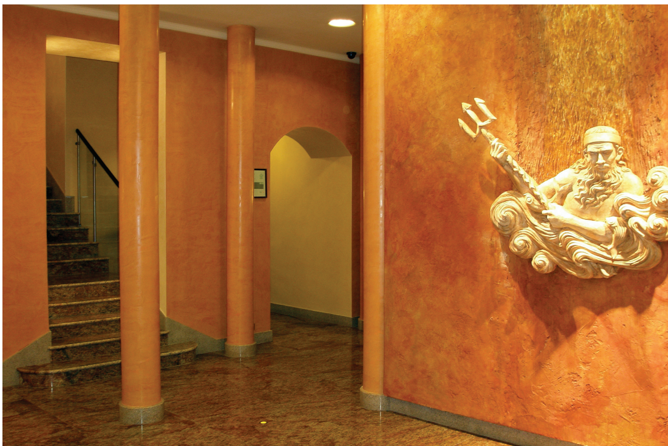
PROMATUBEX® – ochrana ocelových sloupů kruhového průřezu