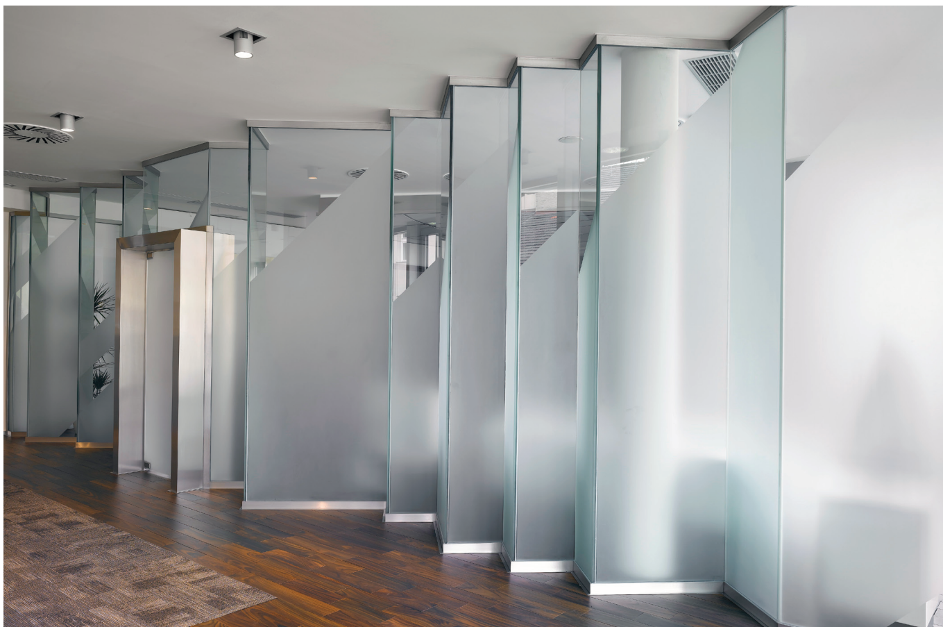
Prosklené příčky s dekorativním potiskem