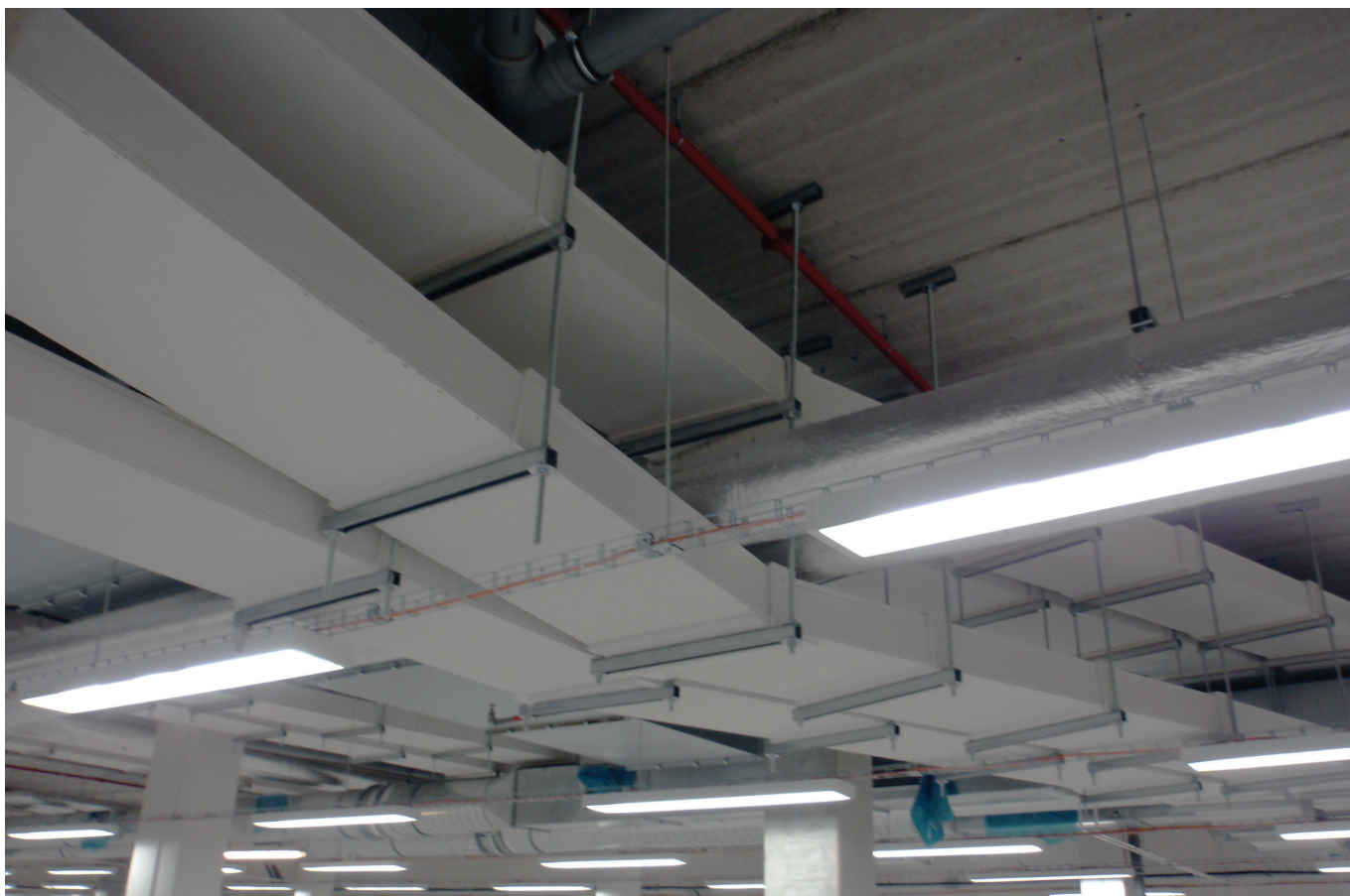
Kabelové kanály PROMATECT®