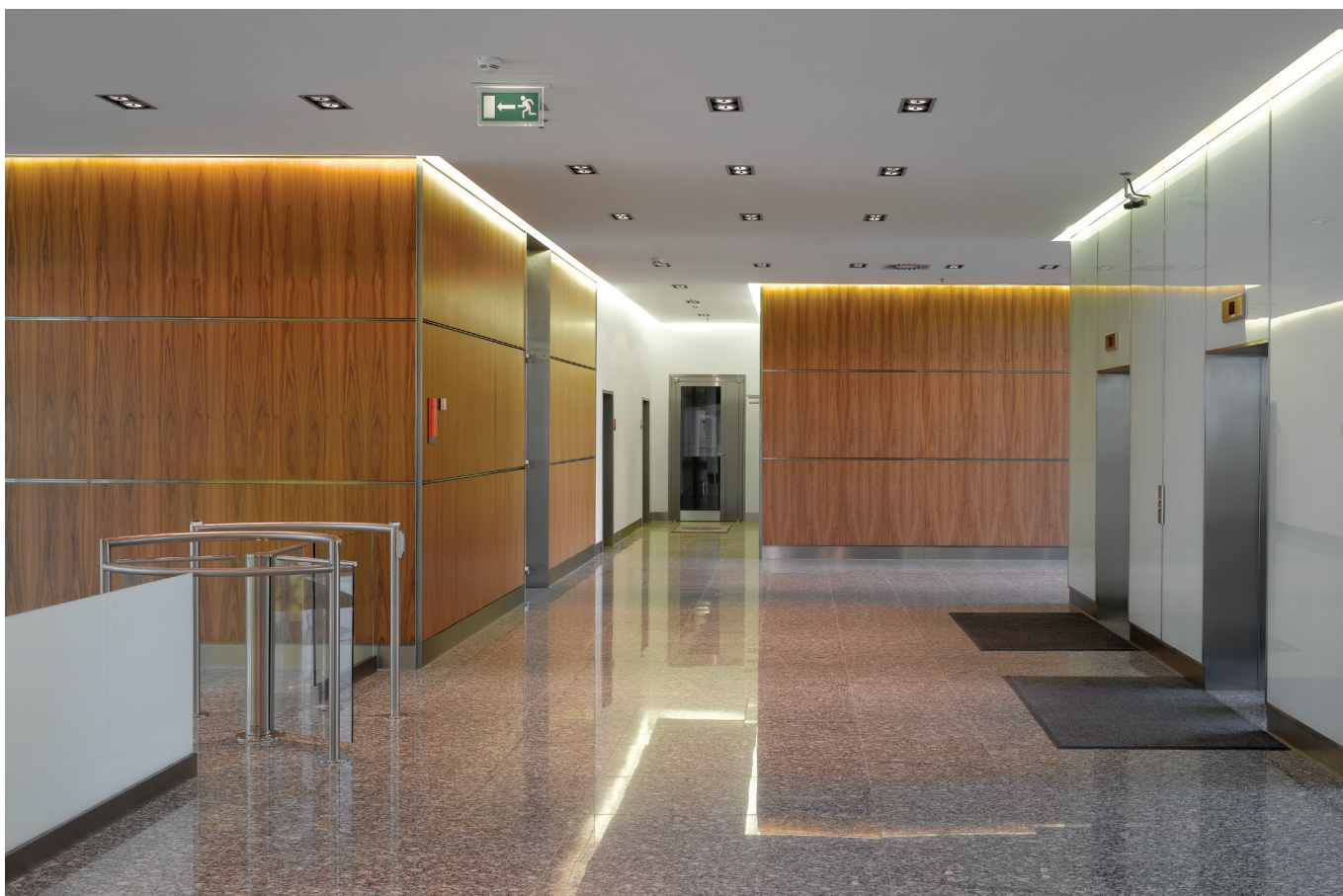
Dekorativní obklad nehořlavými deskami PROMATECT®-H