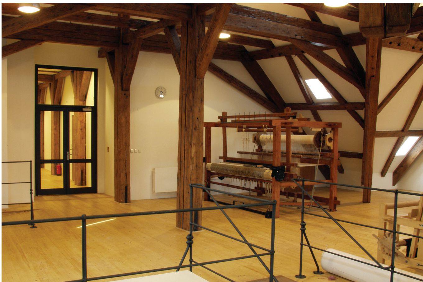
Nátěr na dřevo PROMADUR®