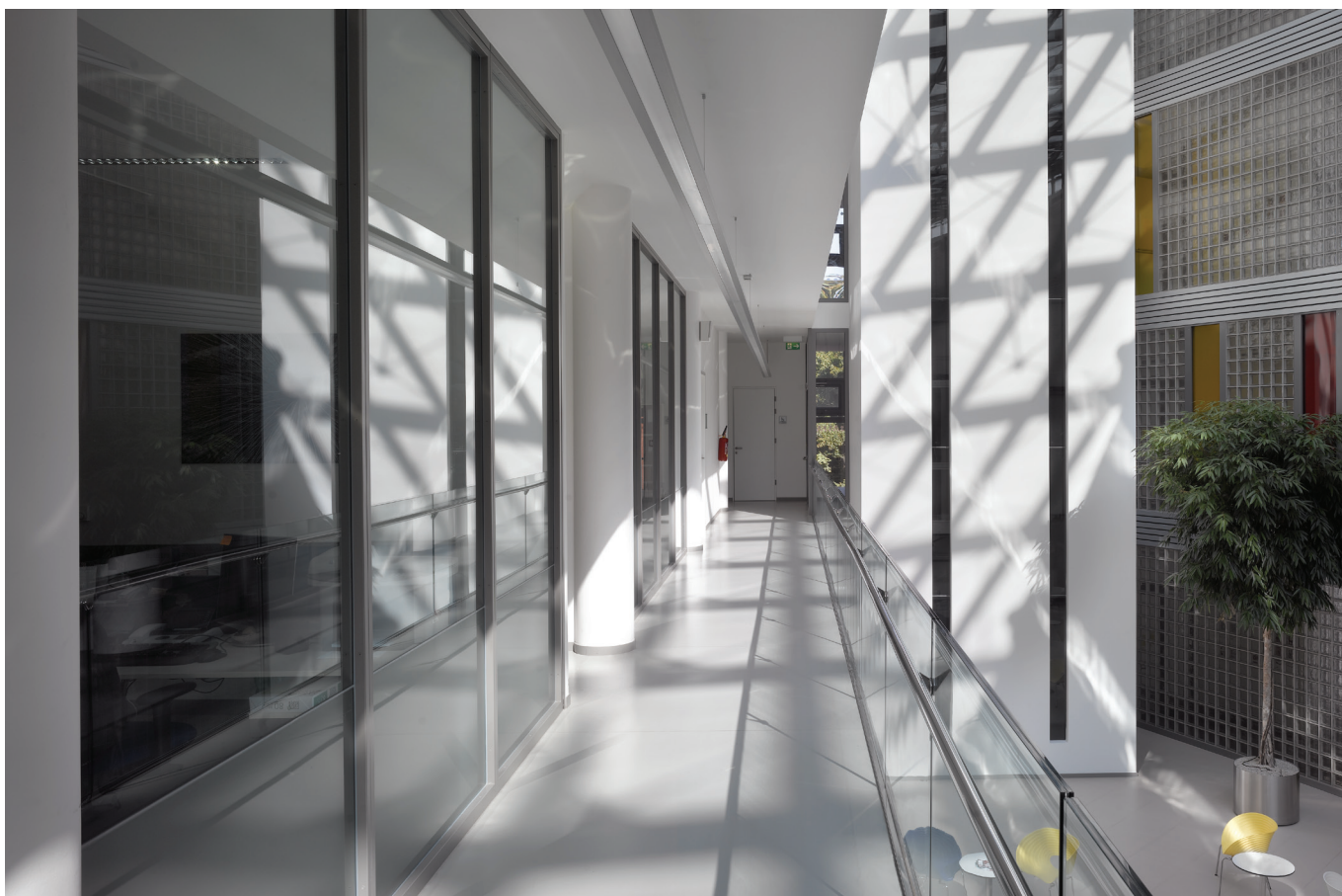
Systemová stěna PROMAGLAS®