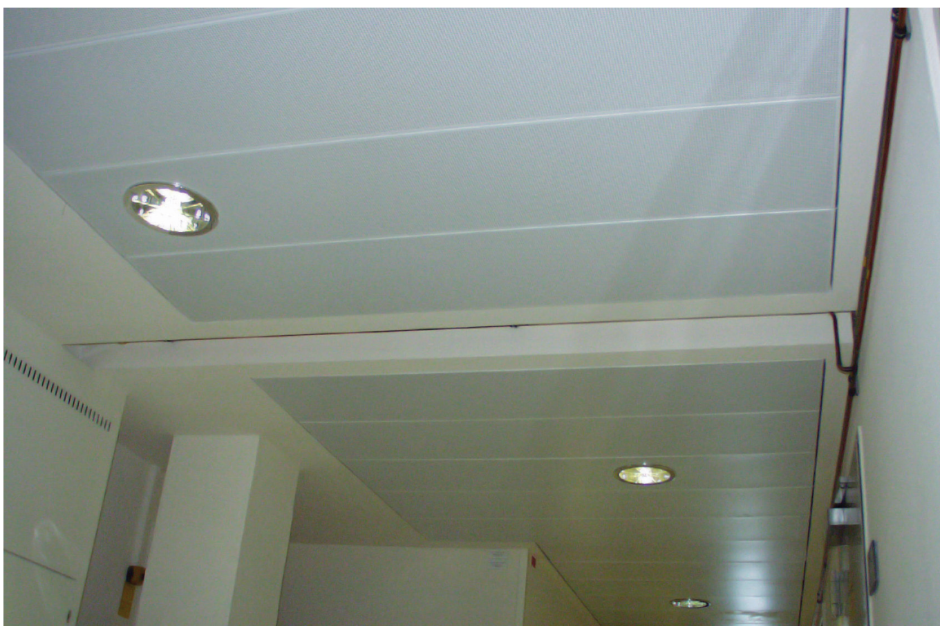
Demontovatelný sklápěcí kovový podhled PROMATECT®